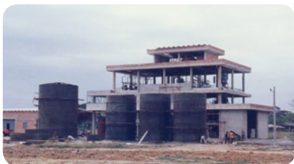
Avance obra civil planta

En su plan de mejoramiento continuo, DEL LLANO S.A. inició el montaje de una planta para la refinación, frac-