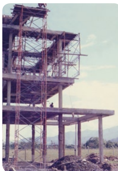
Siempre, con tecnología de punta

DEL LLANO S.A inicia su labor en 1988 con su planta de producción ubicada en el kilómetro 8 vía Villavicencio - Restrepo; donde aún permanecemos con las áreas de producción, empaque, almacenamiento, laboratorio, taller, bodega y oficinas.