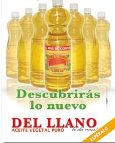
Pieza Gráfica Campaña de Expectativa

Siguiendo los lineamientos trazados ACEITE VEGETAL PURO DEL LLANO, ha posicionado su nueva imagen y en este momento el área de Mercadeo se enfoca en la divulgación de las bondades del producto y cubrimiento de nuevas plazas.