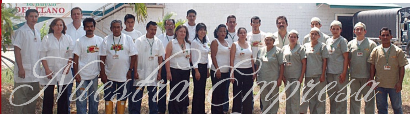
Colaboradores Del Llano S.A. - Planta