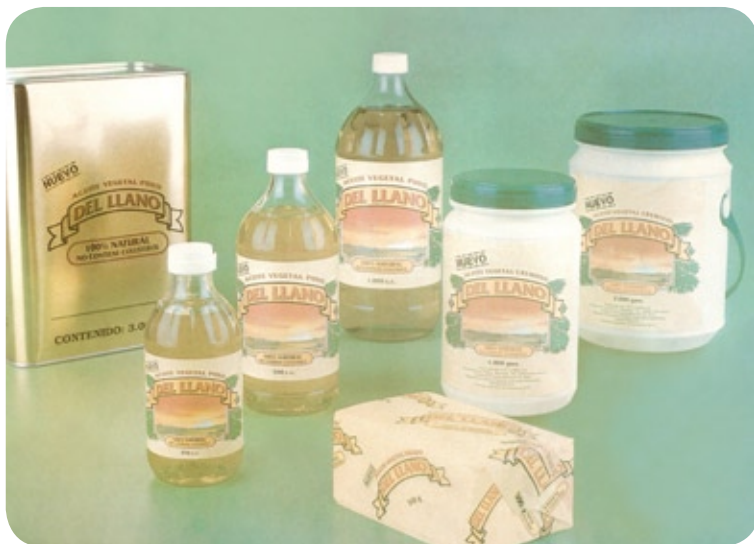
Línea de Producto Del Llano 1989

Al compás de la modernización de nuestras instalaciones, equipos y la capacitación constante del personal nuestro producto líder también ha experimentado cambios.