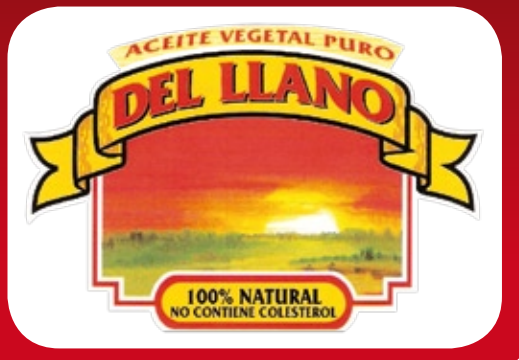
Logo que por 19 años fue imagen de la Línea de Producto Del Llano