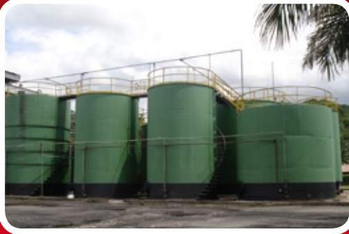
Tanques de Almacenamiento