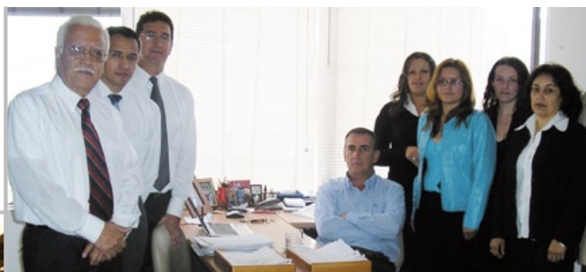
Colaboradores Del Llano S.A. Bogotá