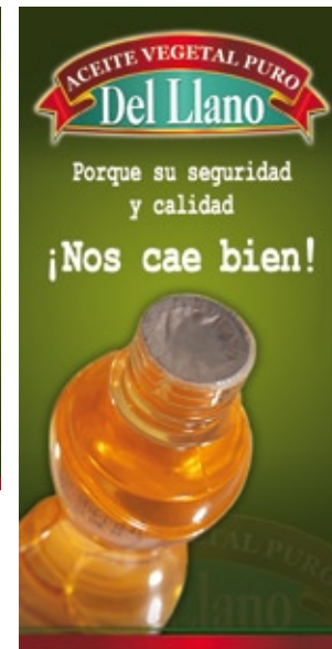
Pieza Gráfica Foil