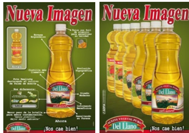
Piezas Gráficas Campaña de Lanzamiento

Siguiendo los lineamientos trazados ACEITE VEGETAL PURO DEL LLANO, ha posicionado su nueva imagen y en este momento el área de Mercadeo se enfoca en la divulgación de las bondades del producto y cubrimiento de nuevas plazas.