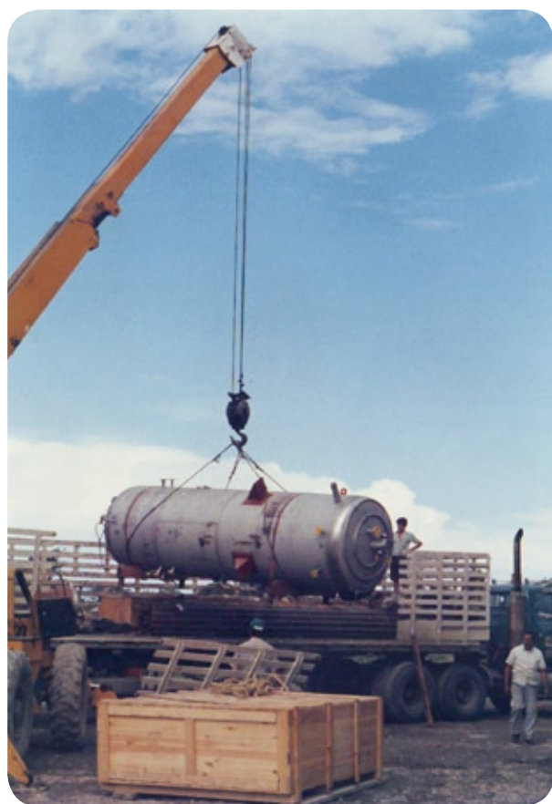
Equipos importados de Bélgica de la firma De Smet.