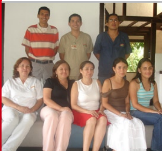
Colaboradores Área Administrativa Del Llano S.A. Planta